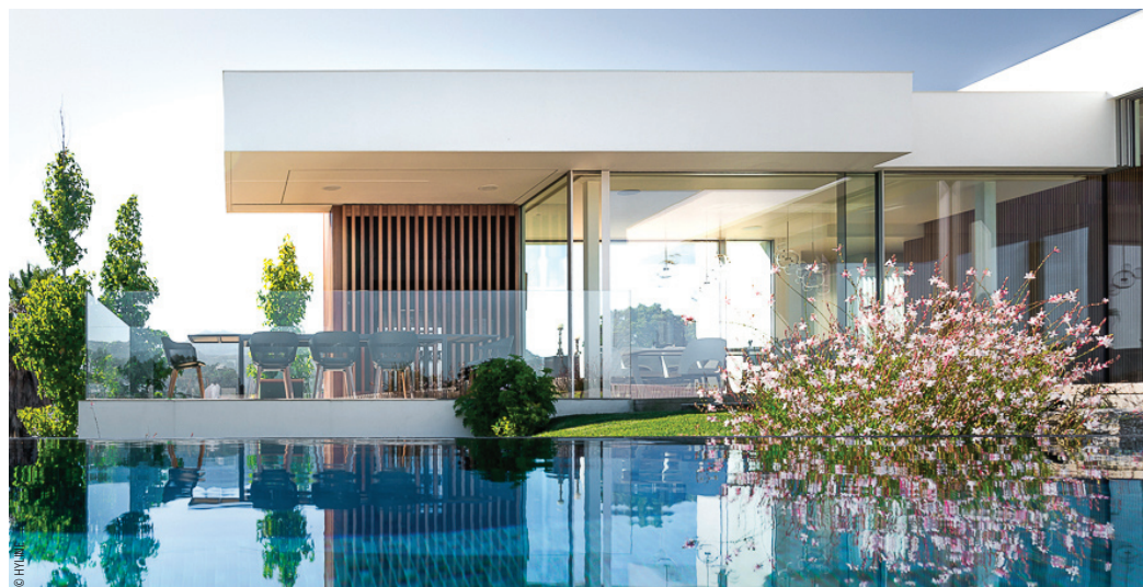
Villa Vigo – Cette réalisation contemporaine exceptionnelle bénéficie des solutions HYLINE Architecte : Juan Iglesias

Le spécialiste de la menuiserie minimaliste pour les marchés premium et du luxe poursuit son développement et, à travers l'horizon immense de ses baies, bénéficie d'une large perspective où placer ses ambitions.