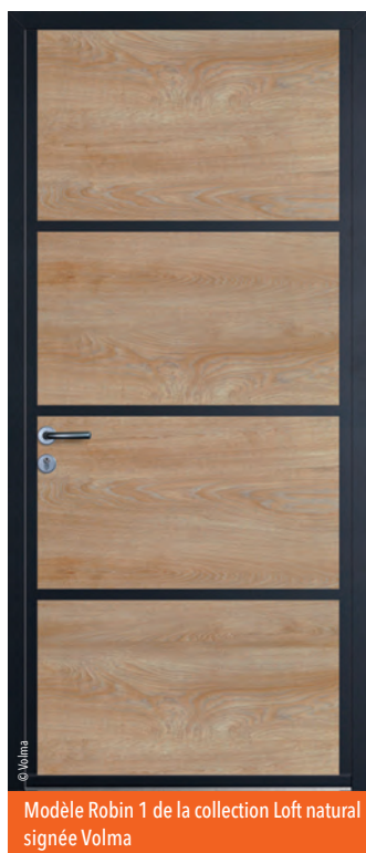
Modèle Robin 1 de la collection Loft natural signée Volma

chauffant. « Ce marché émerge avec la porte d'entrée vitrée, c'est assez facile à installer et