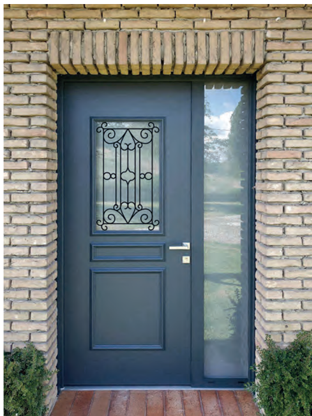
Modèle Edison avec décor grille impression numérique conçu par Euradif