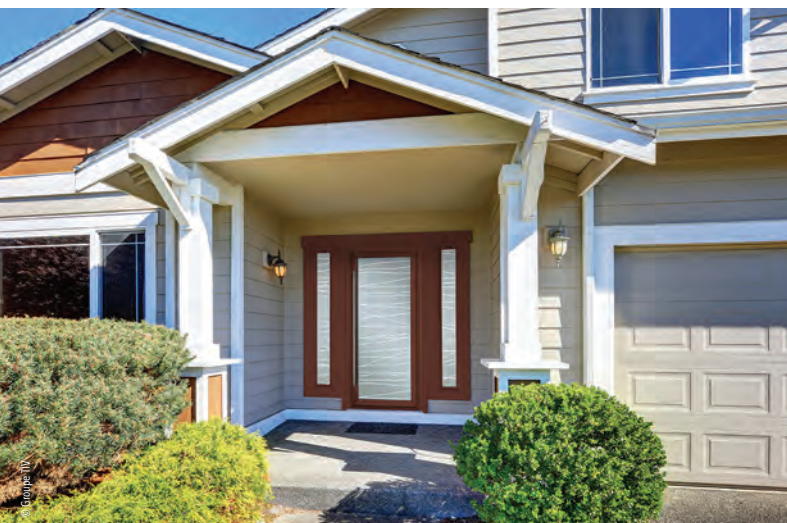
Collection Créativ® signée TIV