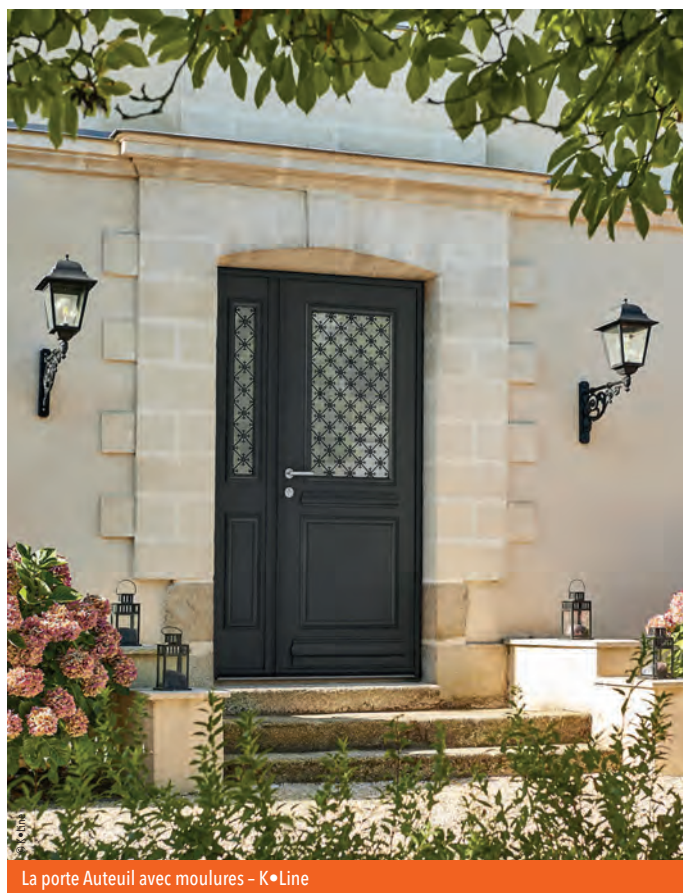
La porte Auteuil avec moulures - K•Line