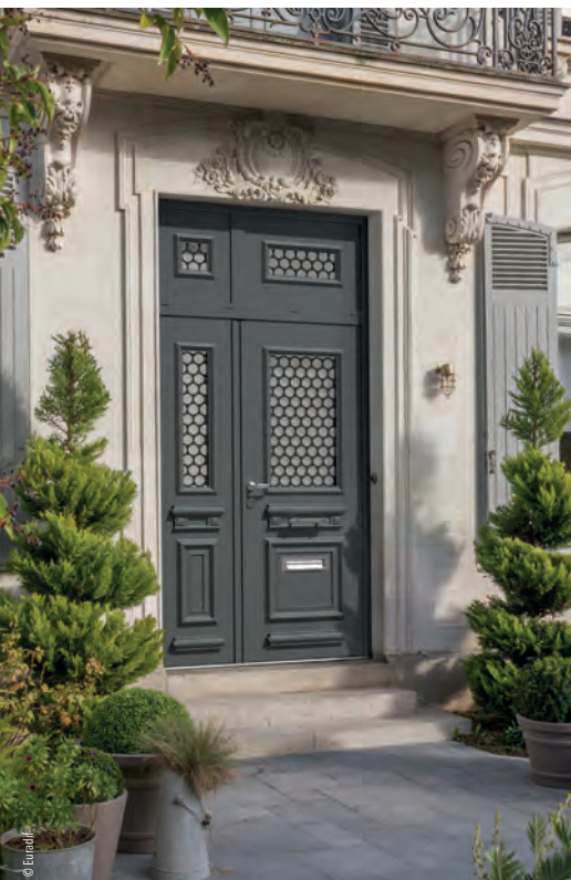
Modèle Spencer et grille Alva semi-fixe & imposte Euradif